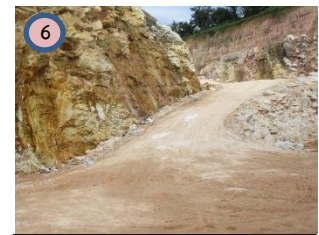
เส้นทางขนส่งแร่ในพื้นที่โครงการ