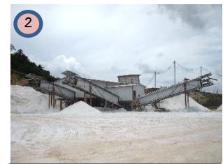
โรงแต่งแร่ของโครงการ