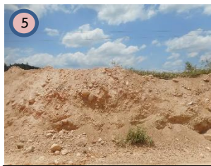
พื้นที่เก็บกองเปลือกดิน/เศษหิน