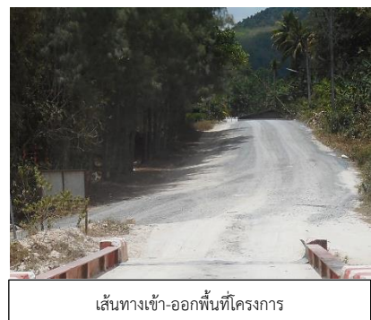
เส้นทางเข้า-ออกพื้นที่โครงการ