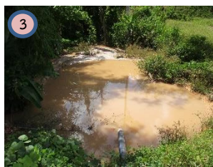
บ่อดักตะกอน บ1