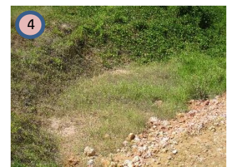
บ่อดักตะกอน บ2