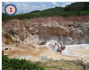
พื้นที่ทำเหมืองปัจจุบัน